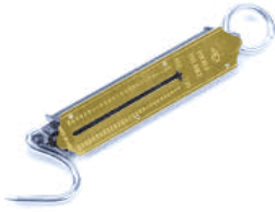
unster (trekveer principe)